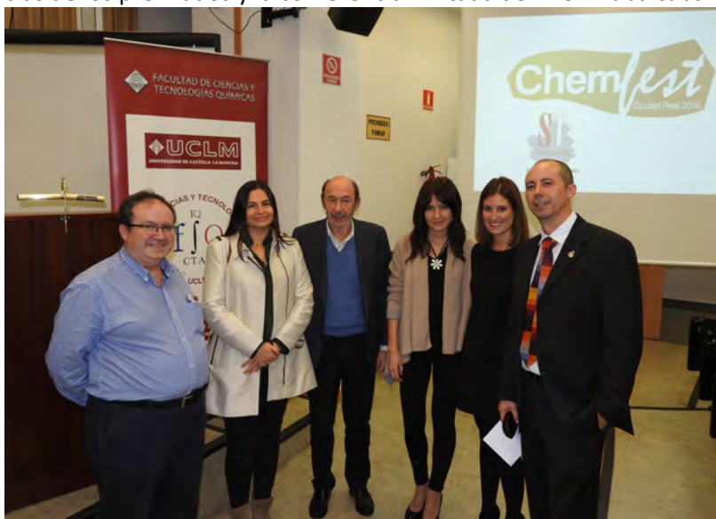
El Prof. Alfredo Pérez Rubalcaba junto a las premiadas y los responsables de la Real Sociedad Española de Química en Castilla-La Mancha

- II Edición de los premios a la mejor Tesis Doctoral de la Sección Territorial (2015-2016) . Dentro del festival “ChemFest, Ciudad Real 2016”, se realizó un acto de entrega de premios con conferencias de los premiados y la conferencia invitada del Prof. Rubalcaba.